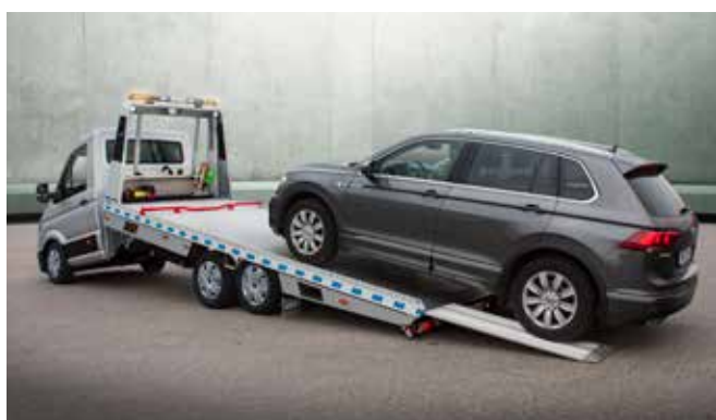
Serienmäßig niedriger Auffahrwinkel von nur 9°.