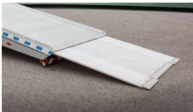
Unkompliziert können Fahrzeuge mit geringen Spurweiten oder Anhänger verladen werden: durch optionale, elektrische, ausfahrbare Mittelrampe.