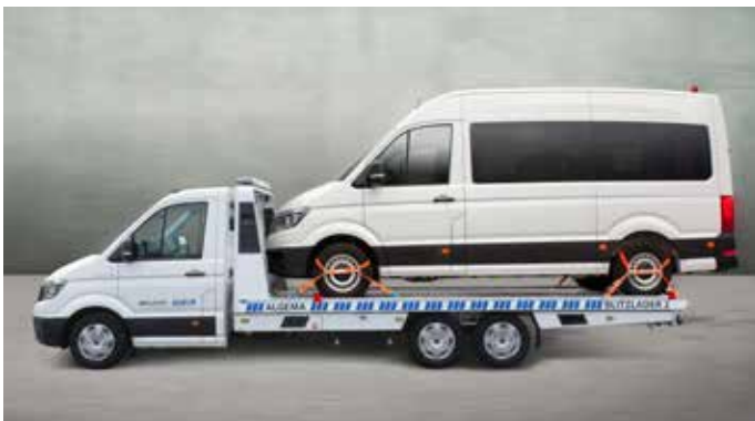
Nutzlast bis zu 3,1 t bei einem 3,5 t Basis-Fahrgestell.