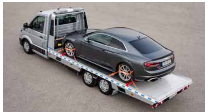
Ideale Lösung für Transportaufgaben.