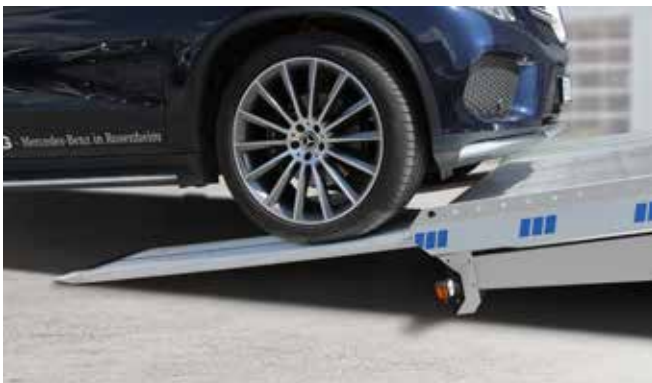
Serienmäßig niedriger Auffahrwinkel von nur 10°.

Mit dem Blitzlader 2 stellt ALGEMA die konsequente Weiterentwicklung des Blitzladers vor. Das komplett neu entwickelte Fahrwerk macht den Blitzlader 2 noch sicherer und komfortabler. Erleben Sie professionellen Autotransport mit dem robusten Knick-Mechanismus für schnellstes Be- und Entladen.