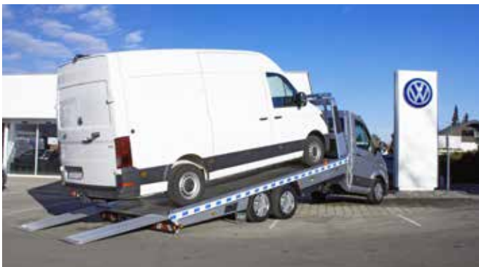
Nutzlast bis zu 3,1 t bei einem 3,5 t Basis-Fahrgestell.