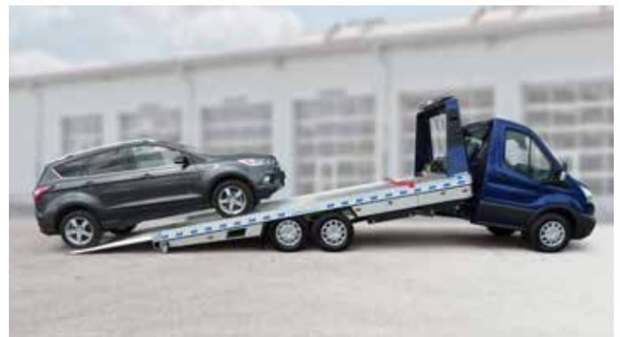
Ideale Lösung für Transportaufgaben.