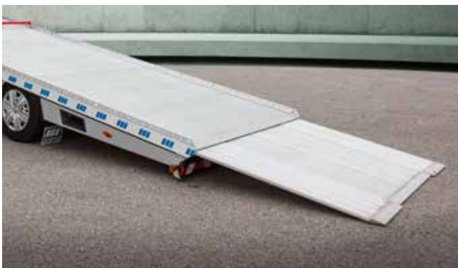
Unkompliziert können Fahrzeuge mit geringen Spurweiten oder Anhänger verladen werden: durch optionale, elektrische, ausfahrbare Mittelrampe.