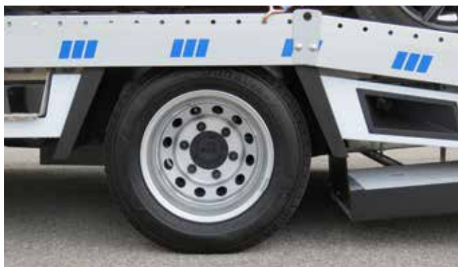
Die neuentwickelte Vollluftfederung sorgt für eine niedrige Ladehöhe und Auffahrwinkel von ca. 11°.