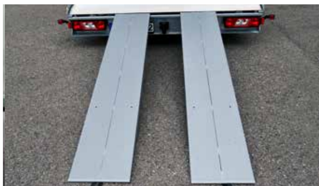
Zwei auszieh- und seitlich verschiebbare ALU-Ladeschienen. Die neuen Ladeschienen sind hinten unter der Ladefläche gesichert.