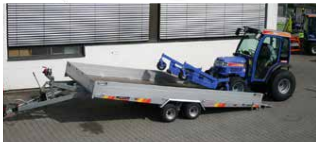
Abkippen über Spindelkippeinrichtung oder hydraulischer Kippeinrichtung