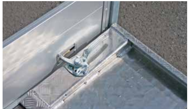
Heckklappe optional nach innen umlegbar. Somit können Luftwiderstände während der Fahrt vermieden werden.