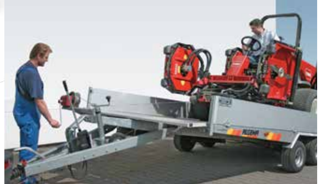
Handseilwinde in Arbeitshöhe für komfortablen Betrieb. Exakte Zugseilspulung durch Rollenumlenkung unabhängig vom Zugwinkel.

ALGEMA Anhänger sind schnell, sicher und komfortabel einsetzbar, auch unter widrigen Bedingungen. Denn in jedem ALGEMA Leichtbauanhänger sind gute Ideen serienmäßig eingebaut.