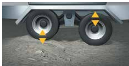
Einzelradaufhängung und Dreieckslenker mit Pendelachsen sorgen für sichere Bodenhaftung und kontinuierliche Stützlast am Zugfahrzeug.