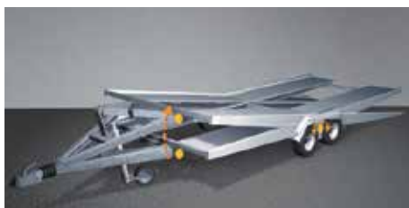
Absenken der Ladefläche in Sekunden dank Knick-Chassis. Der Verzicht auf schwere Hilfsrahmen senkt das Gesamtgewicht und erhöht die Nutzlast.