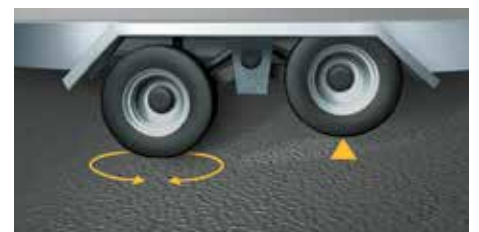
Hinterachse mit optionaler Lifieinrichtung: Ermöglicht ein leichtes Rangieren des Anhängers per Hand.