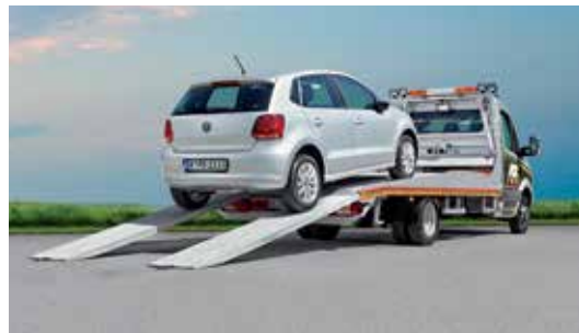
Ob Pannendienst oder Neuwagenüberführung: das FESTPLATEAU ist – mit Anhänger – auch für den Transport von mehreren Fahrzeugen zu haben.