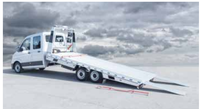
Ideale Lösung für Transportaufgaben.