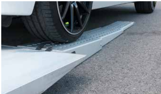
Mit optionalen 3-teiligen Auffahrkeilen kann ein niedriger Auffahrwinkel von nur 5° ermöglicht werden, z. B. für Sportwagen.