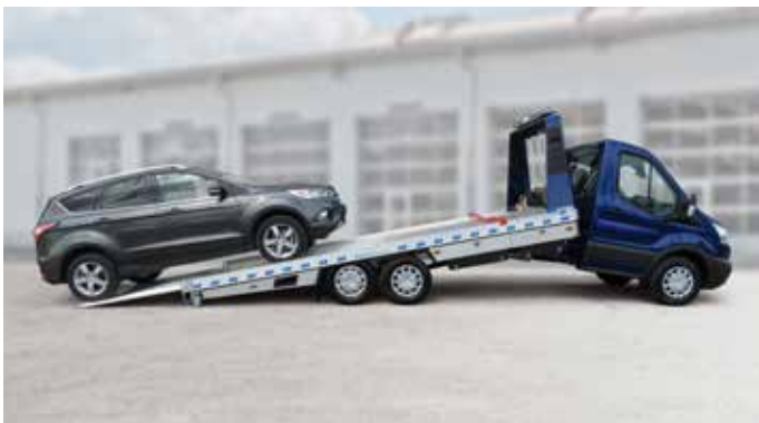
Nutzlast bis zu 3,1 t bei einem 3,5 t Basis-Fahrgestell.