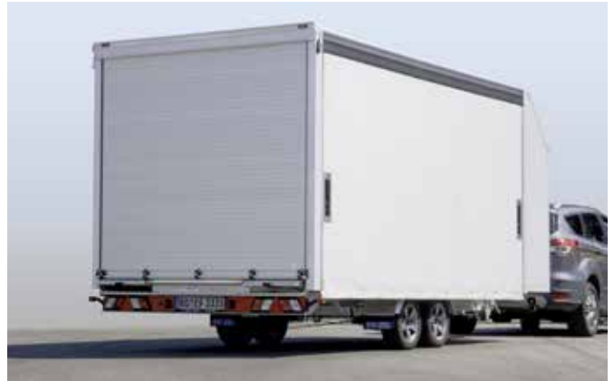
Kofferaufbau EURO-City mit seitlicher Schiebepanene, geschlossen, ...

Farbe: MB 9147 Arktikweiß, pulverbeschichtet