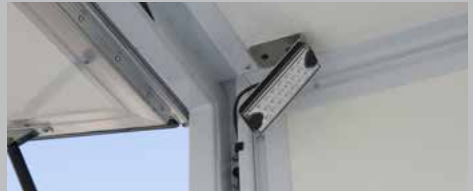
Innenbeleuchtung zum Be- und Entladen bei Dunkelheit, hinten links und rechts angebracht.