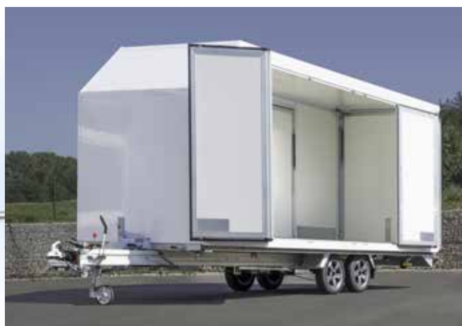
... geöffnet, für freien Zugang zur Ladung.