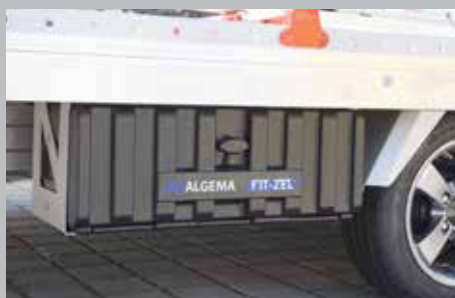
Werkzeugkästen aus Kunststoff bieten viel Stauraum für Werkzeug und Zubehör.