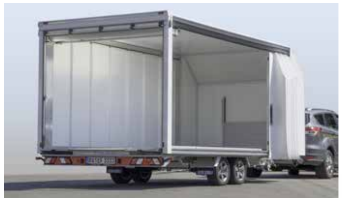
... mit den leichtgängigen Schienen schnell geöffnet.