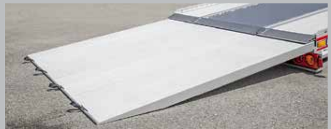
Wertvolle Güter flexibel aufladen mit den optionalen Plateau-Ladeschienen.