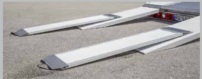
Verringern Sie für flache Sportwagen oder Fahrzeuge mit Spoiler den Auffahrwinkel mit zusätzlichen Ladeschienen.