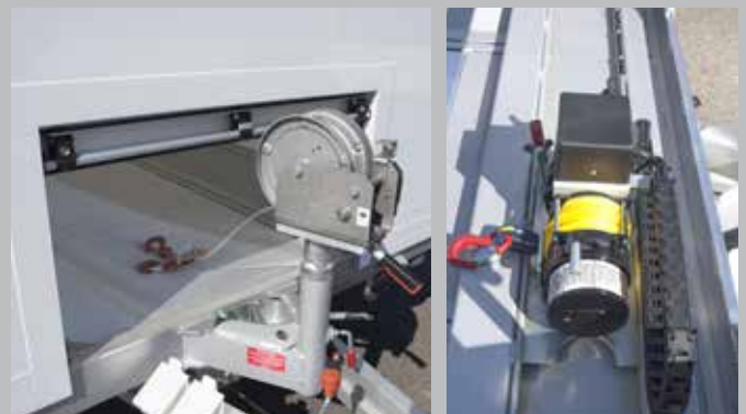
Schnell und problemlos beladen Sie nicht rollfähige Fahrzeuge mit Hand- oder Elektroseilwinden – auf Windenschiene, stufenlos verstellbar.