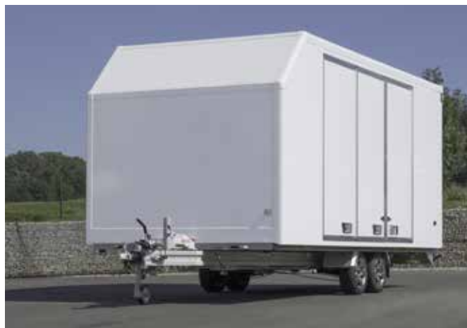
Kofferaufbau EURO-Van mit seitlicher 3-teiliger Tür, geschlossen, ...

Diebstahlgesichert durch abschließbare Türen/Klappen